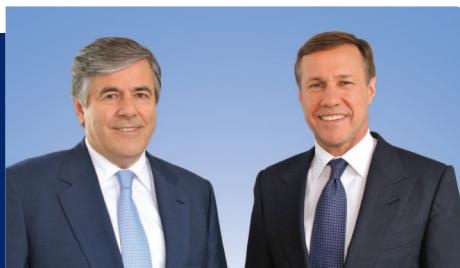
Dr. Josef Ackermann